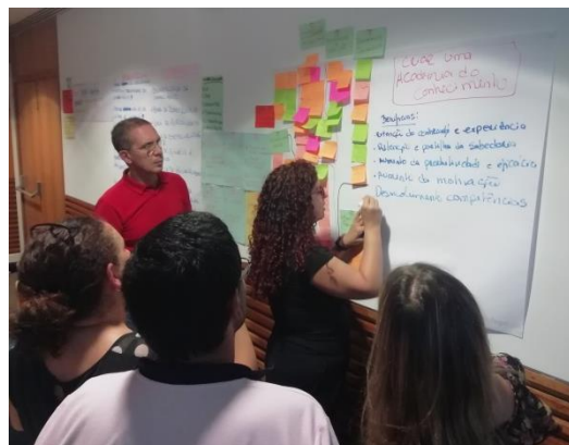
Protótipo da ideia 'Academia IEFP' elaborado pelo grupo de trabalho.